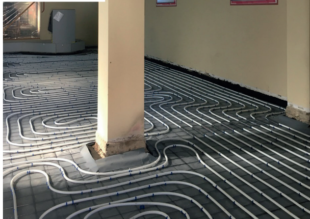
Fußbodenheizleitungen und Vorinstal- lation Heizung/Sanitär, August 2020