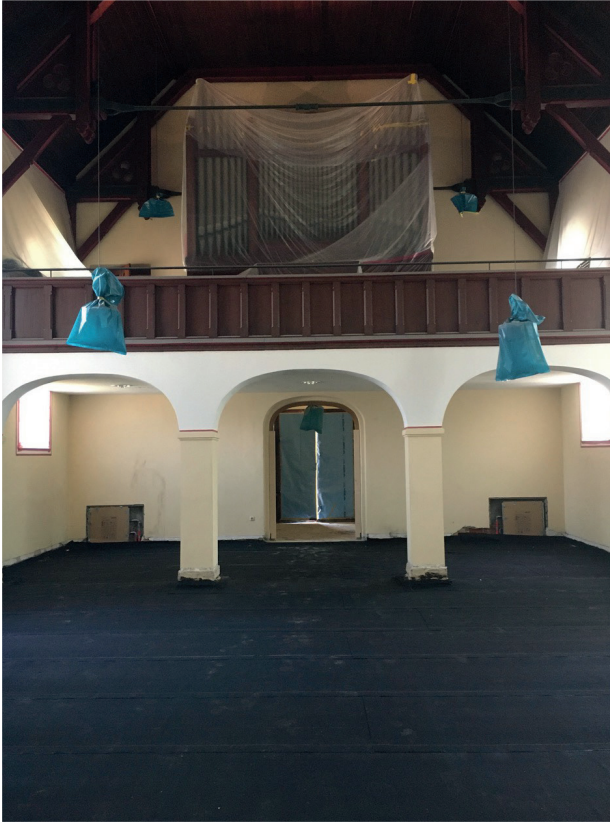
Wärmedämmung und Abdichtung, Juli 2020