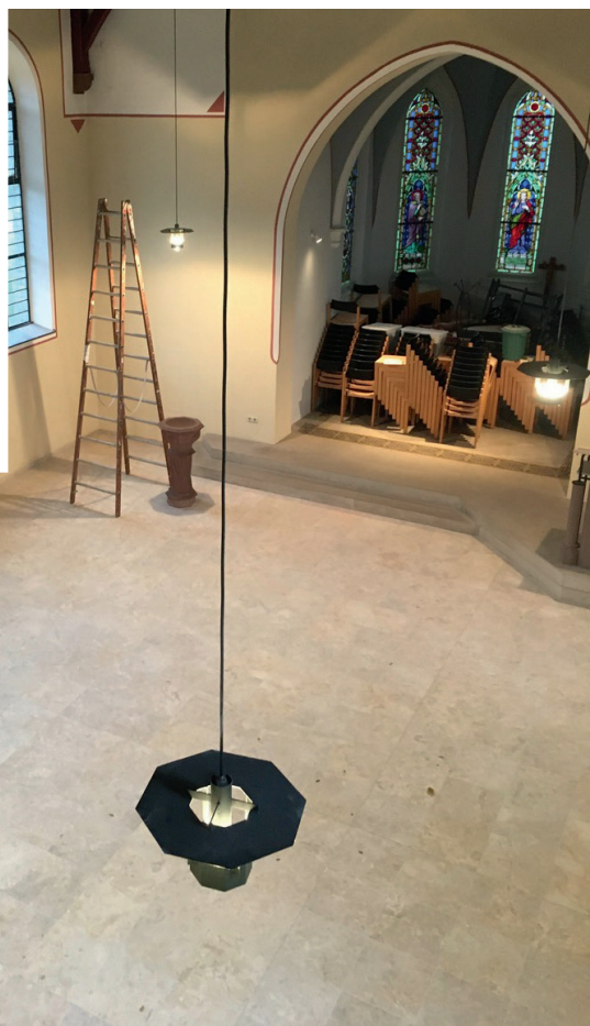
Fertigstellung: November 2020 (Foto: Sebastian Thiemann, Architekt; www.sebastian-thiemann.de )